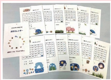
2025 年 点字カレンダー

点訳サークル『てんとうむし』では毎年 年末に点字の壁掛けカレンダーを作って町 内の小中学校や公共施設にお届けしていま す。点字と文字の両方で表した 2026 年の B5 判カレンダーを、点字に興味のある方に さしあげます。 ご希望の方は、 11 月末まで に社会福祉協 議会にご連絡 ください。