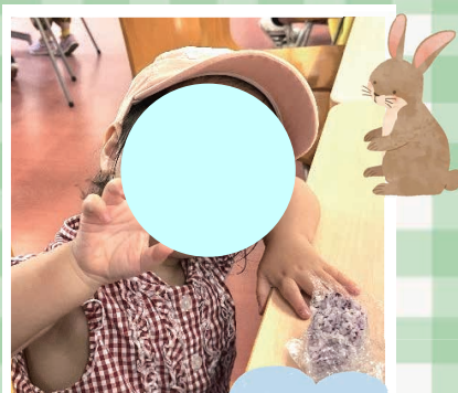
こはる 心遥ちゃん (2 歳 5 カ月)