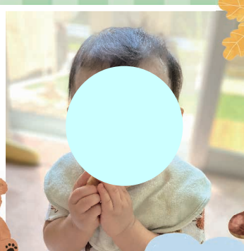
ゆうき 侑来ちゃん (1 歳 0 カ月)