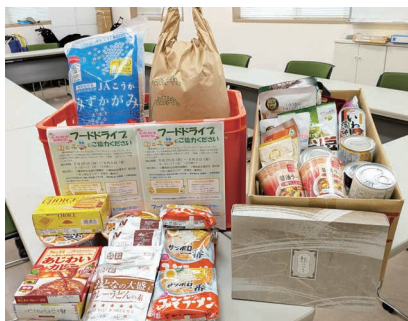
もったいないをありがとうございます

関西フードマーケット様やコープこうべ様、地域貢献委員会(祥雲館、北摂信愛園、のせの里)の皆さまにもご協力いただきました。ご協力いただいた皆さまに心より感謝申し上げます。なお、社会福祉協議会ではフードドライブを常時受け付けています。