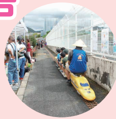
ふれあいのつどい