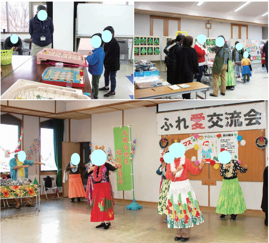
南国の雰囲気を感じるフラダンスや音楽遊びで、賑やかな時間となりました。