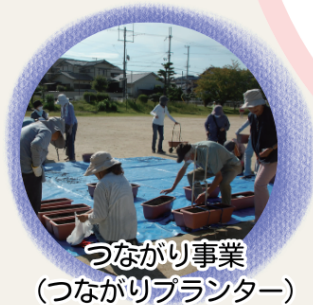
つながり事業 (つながりプランター)