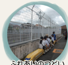
ふれあいのつどい