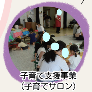
子育て支援事業 (子育てサロン)