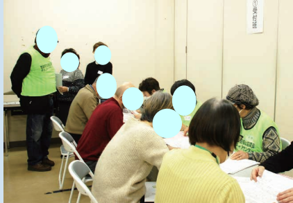
(下)参加者同士で協力し、設置訓練に取り組みました。

～生活福祉資金コロナ特例貸付を利用された皆様へ～ 手続き・償還を含め生活にお困りの場合は、社会福祉協議会までご相談ください。