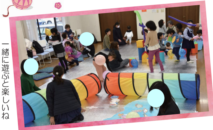
一緒に遊ぶと楽しいね

11月16日、新光風台地区でコロナ禍を経て5年ぶりに「子育てサロン」が開催されました。ボールプールや手作りおもちゃで遊んだ後は、みんなでお弁当を食べて交流を図りました。バイオリンの演奏も行われ、穏やかなひとときとなりました。