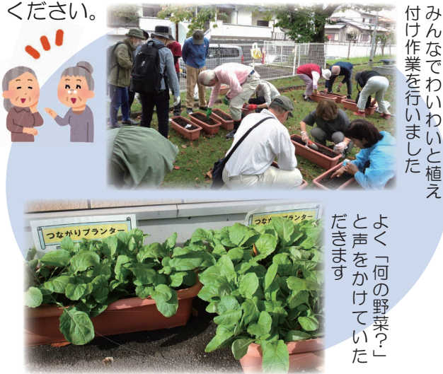
みんなでわいわいと植え付け作業を行いました

コロナ禍でもご近所同士で生育状況について声をかけ合い、つながりを続けようと開始した『つながりプランター』。10月に植えた大和真葉が社協前でもすくすくと成長しています。ご近所で育てている方をみられましたらお声かけください。