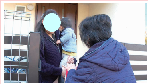
昨年の訪問の様子