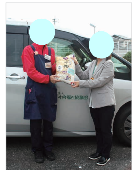
コープこうべさんからもお米をご寄付いただきました

常設のフードドライブと、11/1~8に実施しましたフードドライブ強化週間とを合わせ、食料品・日用品 590kgのご協力をいただきました。皆さまから寄せられました品物は町内で必要とされている方や子ども食堂、つながりカフェ等にお届けいたします。この事業にご協力くださいました皆さまに心より感謝申し上げます。またフードパントリー（食料品の無料配布）も行っておりますので、様々な事情によって生活にお困りで、食料品・日用品が必要な方は社会福祉協議会までご相談ください。