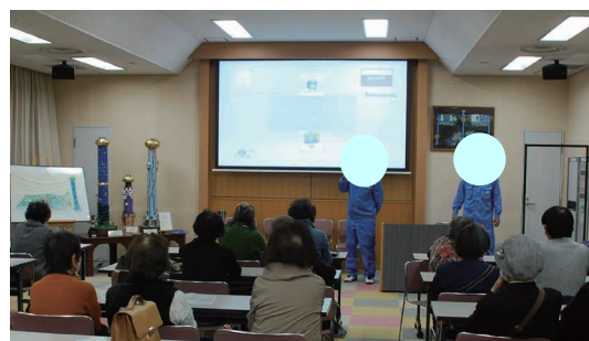
焼却灰は道路などに活用されます