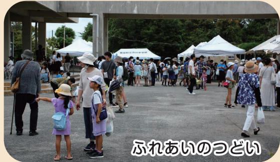
ふれあいのつどい