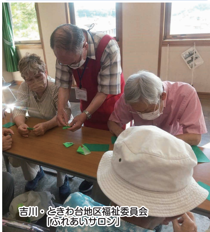
吉川・ときわ台地区福祉委員会 「ふれあいサロン」