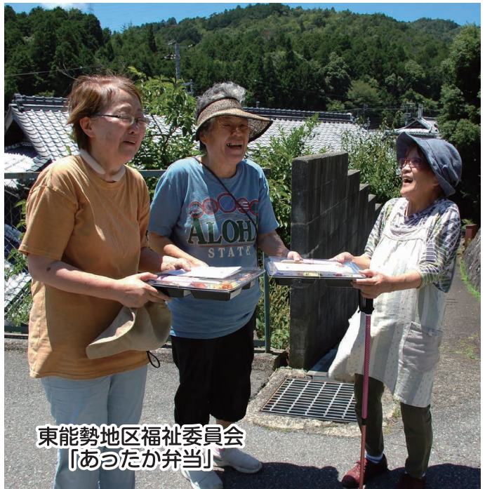
東能勢地区福祉委員会 「あたたか弁当」