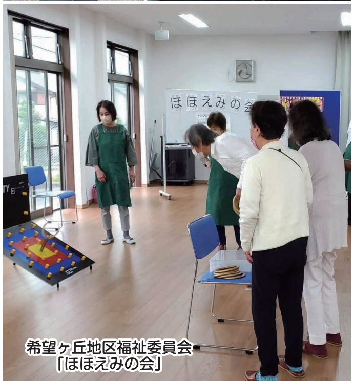
希望ヶ丘地区福祉委員会 「ほほえみの会」