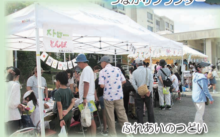
ふれあいのつどい