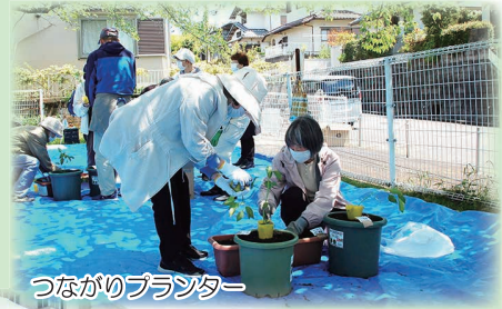
つながりプランター