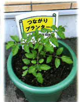
みんなでなごやかに作業しました