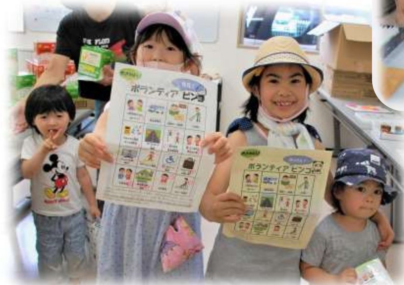
子どもから大人まで多くの人に参加してくださいました