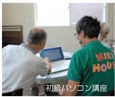
初級パソコン講座

個人ボランティアに依頼したい方、得意なことを生かして活動したい方、お気軽にご連絡ください。