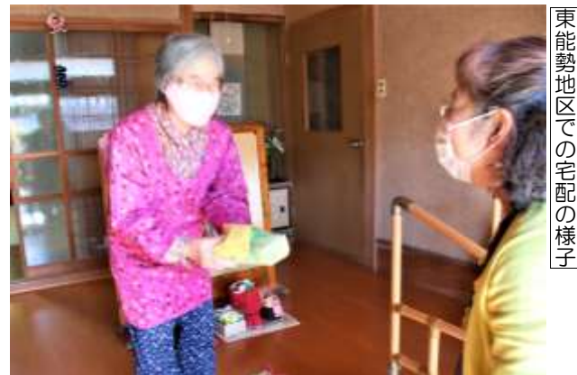
東能勢地区での宅配の様子

利用されている方からは『ひとり分の食事を作るのがおっくうなので助かります』『福祉委員の方が届けてくれるので、お話することができてうれしいです』などのお話もお聞きしました。地区福祉委員会ではこれからも地域のつながり作りのための活動を続けていきます。