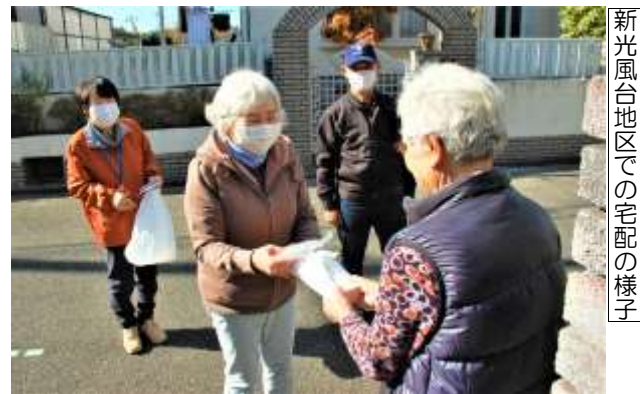
新光風台地区での宅配の様子

各地区福祉委員または社会福祉協議会 (東能勢地区は社会福祉協議会のみ受付) TEL 072-738-5370