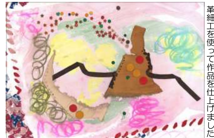
革細工を使って作品を仕上げました