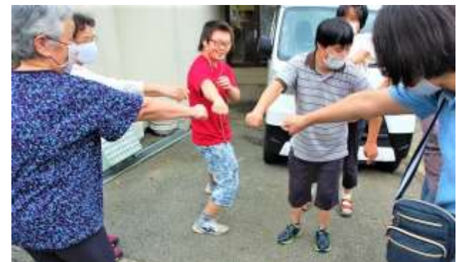
ボランティア連絡会のメンバーがたんぼぼの家を訪問。「こんな時期でなかなか集まらないけれど、がんばって乗り越えましょう」と触れないグータッチ