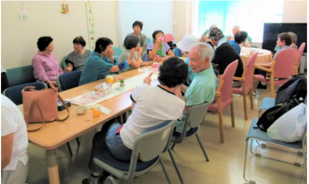
ふれあいカフェにも社協会員会費を活用しています