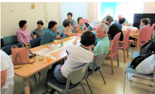
ふれあいカフェにも社協会員会費を活用しています